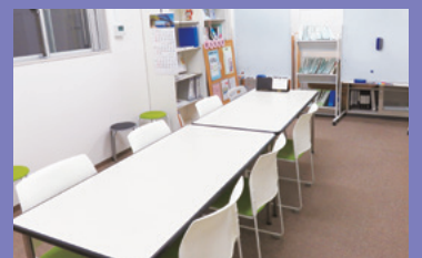
*打合せでもご利用いただける情報コーナー(事前に団体登録が必要です)