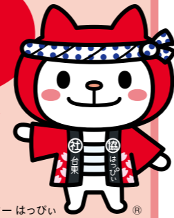
台東社協キャラクターはっぴい

「はっぴいが行く！」第1回は、東上野の成徳院ご住職夫妻が運営している「じょうじゅいんモグモグ食堂」にお邪魔しました！運営者、ボランティアさん、参加者とともに楽しいひと時を過ごすことができました。