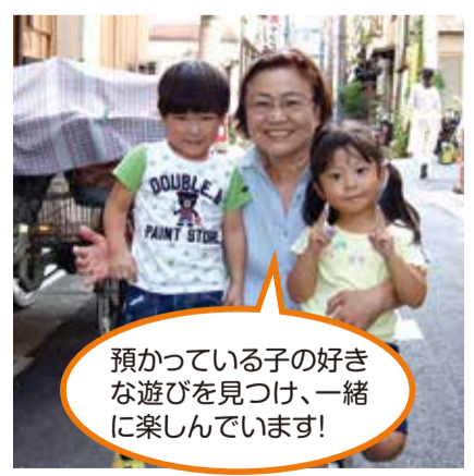
預かっている子の好きな遊びを見つけ、一緒に楽しんでいます!

小学生以下のお子様の送迎や預かりを行う有償ボランティア活動です。資格・経験不要で、空いている時間・出来る範囲で活動していただけます。また無理の無いよう、アドバイザーが相談・調整いたします。 台東区ファミリー・サポート・センター ☎03-5828-7548