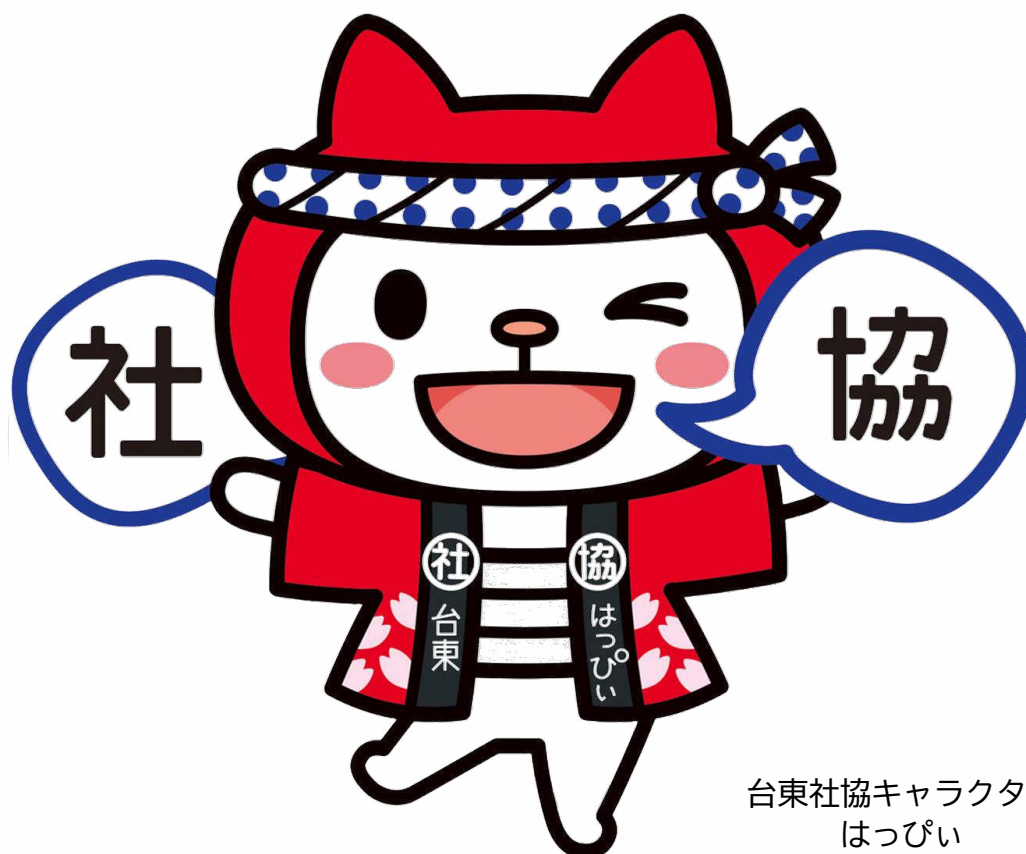
台東社協キャラクター はっぴい