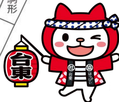
台東社協キャラクター はっぴい