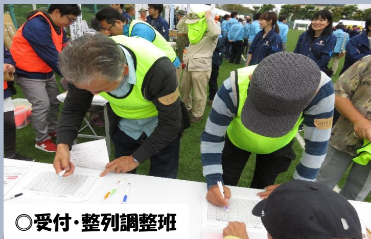
◎受付・整列調整班

今回は台東区の総合防災訓練で『 災害ボランティアセンター 』の立ち上げ訓練を行った時の様子をご紹介します！