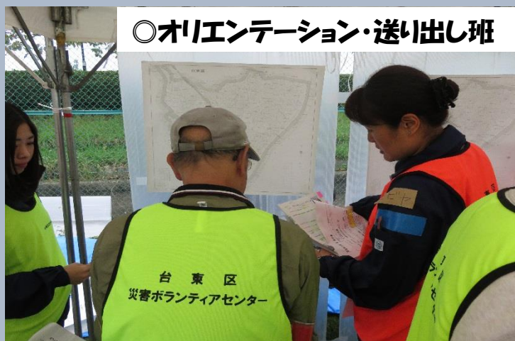
◎オリエンテーション・送出し班