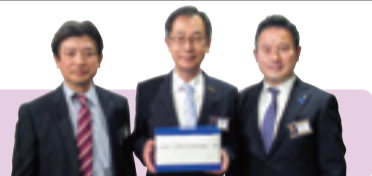
東京浅草中央ロータリークラブ様より、ご寄付を頂戴いたしました。