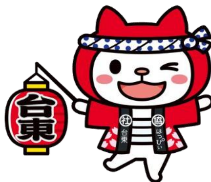
台東社協キャラクター はっぴい

馴染みのある場所の近くにある活動先や 興味のある活動をしている活動先を 活動先一覧で探してみよう！！