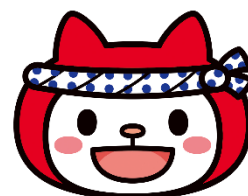
台東社協キャラクター はっぴい