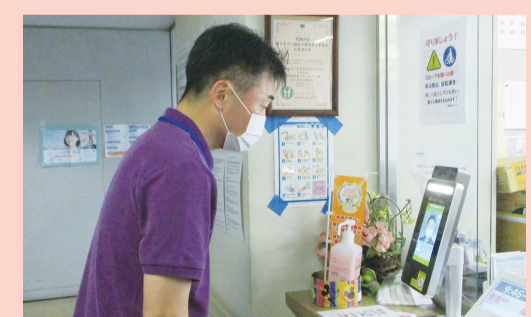
スタッフの出動時は必ず検温しています

緊急事態宣言以降、ご家族との面会やコンサートなどのイベントができず、楽しみが減っていると思います。冬からはインフルエンザの流行にも備えなければなりません。このような状況ですが、入居者の皆様に楽しくいきいきと生活していただけるように、スタッフ一丸となって取り組んでいます。