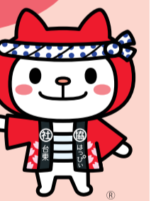
台東社協キャラクター はっぴい

今回は台東区社会福祉事業団が運営している「特別養護老人ホーム三ノ輪」にて話を伺いました。