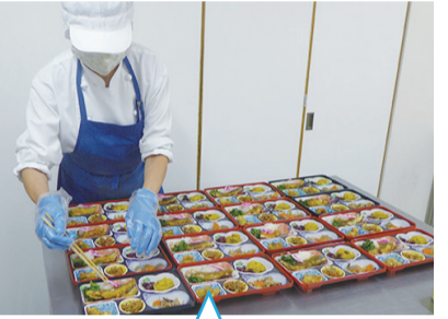
こまめに消毒された 調理現場で真心込めて