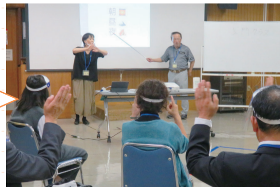
距離は取りつつ 相手の表情は しっかりと

手話は手の動きのほか、口の動きや表情を見ることが必要です。新型コロナウイルス感染症対策として、講師・受講生にはマスクではなくフェイスシールドを着用してもらい、口の動きが分かるようにするなど、工夫をしながら講習会を進めています。