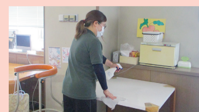
上 トイレ消毒も念入りに 下 消毒しながらテーブル拭き

緊急事態宣言以降、ご家族との面会やコンサートなどのイベントができず、楽しみが減っていると思います。冬からはインフルエンザの流行にも備えなければなりません。このような状況ですが、入居者の皆様に楽しくいきいきと生活していただけるように、スタッフ一丸となって取り組んでいます。