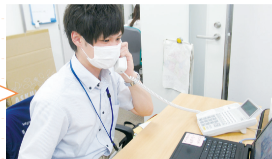
電話でこまめに 近況確認！

マスクを着けてお互いの顔が見えにくい、距離を取らなければならない、こんなときこそ小さな変化に気づく力が必要です。「困っているけど近くに頼れる人がいない」「近所に気になる人がいる」といった地域のSOSがありましたら、コーディネーターと一緒に考えていきませんか？