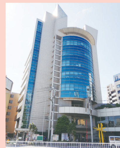
三ノ輪福祉センター外観

「特別養護老人ホーム三ノ輪」って、どんなところですか？ 特別養護老人ホームをご存じですか？日常生活において常時介護が必要で、自宅での生活が困難な高齢者が入所する施設です。よく「特養」と省略して呼ばれていますね。 施設内では、食事、入浴、排せつなどのお手伝いや歩行のリハビリテーションなどを行っています。 特養三ノ輪は、東京メトロ日比谷線三ノ輪駅のすぐ目の前にあります。三ノ輪福祉センター4階から7階にあり、施設内には地域包括支援センターや福祉作業所などがあります。平成6年に開設してから25年、これからも地域に愛される施設を目指していきます。